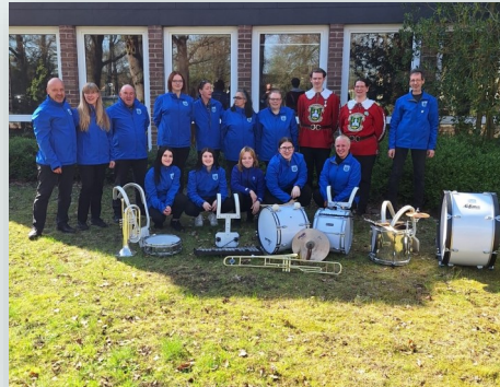
Der Musikzug steht bereits in den Startlöchern.